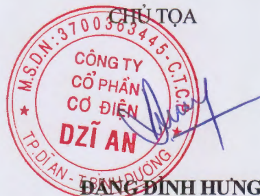
ĐẶNG ĐÌNH HƯNG