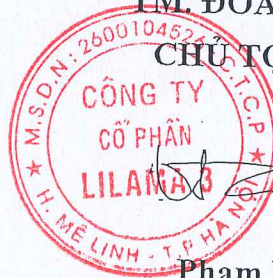
Phạm Ngọc Thao