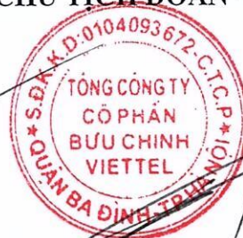
TRẦN TRUNG HÙNG