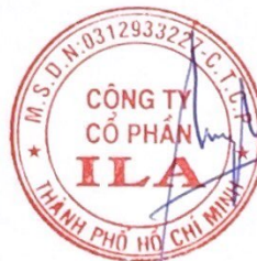
THÂN XUÂN NGHĨA