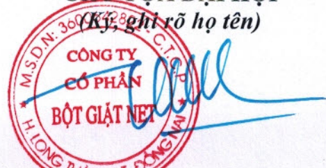
TRẦN QUỐC CƯỜNG