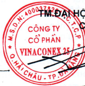
Đặng Như Thịnh