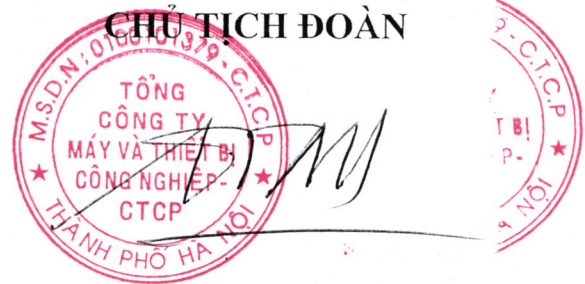
Trần Quốc Toàn