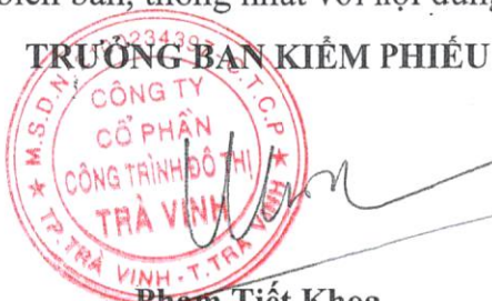
Phạm Tiết Khoa

Biên bản được lập xong lúc 16h00 ngày 24/02/2021, các thành viên tham dự đã đọc biên bản, thống nhất với nội dung nêu trên và ký tên dưới đây.