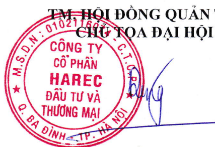
VŨ XUÂN DŨNG