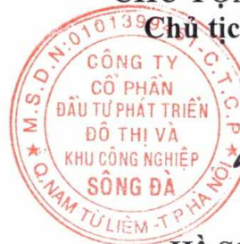
Hồ Sỹ Hùng